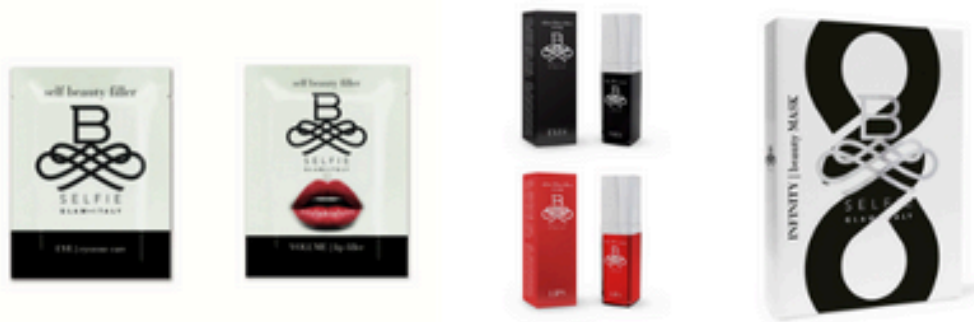
Nella foto, la linea B-SELFIE Skincare Filler System

La nuova linea che arricchisce gli articoli B-SELFIE: ecco i prodotti